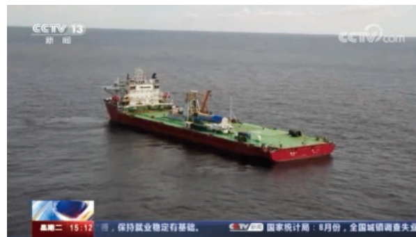
承担山东省重点研发计划重大专项“海上卫星发射与回收”

蔚山船舶与海洋学院秉承学校“党建引领、学科筑峰、育人为本”的办学思路，以鲁东大学服务国家和区域经济社会发展为目标，凭借中外合作办学的独特优势，引进、吸收、融合、创新国际先进教育理念和优质教育资源，紧密对接行业企业，汇聚全校优势学科资源，构筑高水平教学科研平台，积极打造“海上航天装备”学科特色，持续推进学科专业转型升级，打造融通中外、校企合作、院校共建的产学研用一体化学科专业体系，服务国家海洋强国战略。