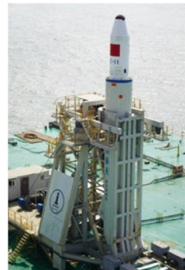
“我国成功实施运载火箭首次海上商业发射” 入选山东省十大科技成果

蔚山船舶与海洋学院秉承学校“党建引领、学科筑峰、育人为本”的办学思路，以鲁东大学服务国家和区域经济社会发展为目标，凭借中外合作办学的独特优势，引进、吸收、融合、创新国际先进教育理念和优质教育资源，紧密对接行业企业，汇聚全校优势学科资源，构筑高水平教学科研平台，积极打造“海上航天装备”学科特色，持续推进学科专业转型升级，打造融通中外、校企合作、院校共建的产学研用一体化学科专业体系，服务国家海洋强国战略。