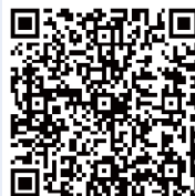
“会员服务系统” 二维码